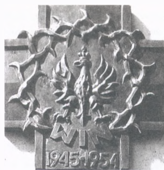
Tablica pamięci żołnierzy Zrzeszenia „WiN” ziemi chełmskiej – Chełm, Bazylika Narodzenia NMP (1994 r.).